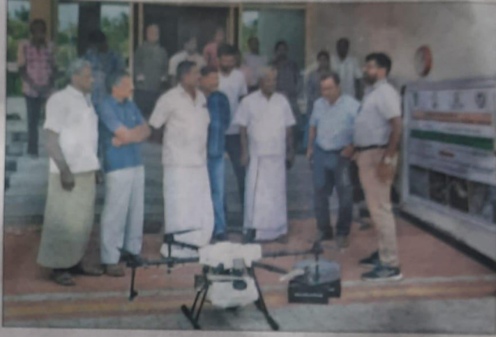
↑ உருமலையில் தென்னை மகத்துவ மையம் சார்பில் வேளாண் தொழிலில் ட்ரோன் பயன்பாடு தொடர்பாக செயல் விளக்கம் அளித்த அலுவலர்கள்.

வெவ்வேறு பயிர்களுக்கான நிலையான இயக்க நடைமுறைகள்,